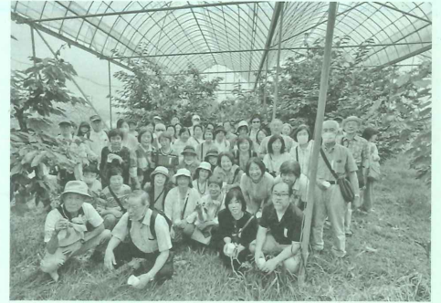
山梨 さくらんぼ狩り